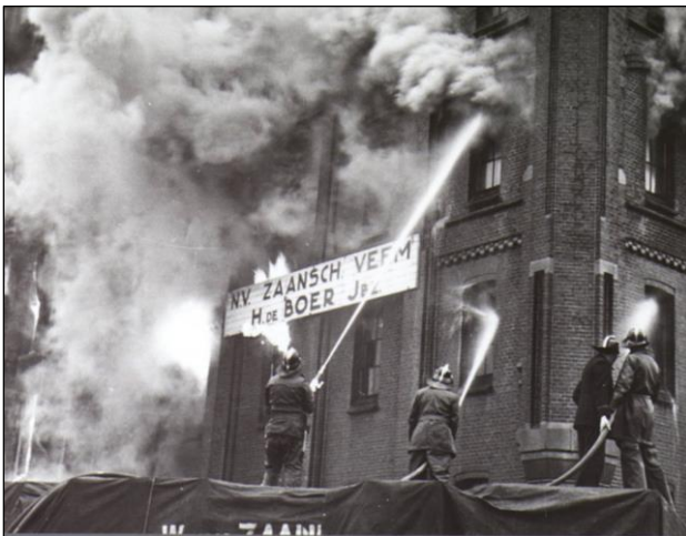
Bestrijding van de brand vanaf dekschuiten.