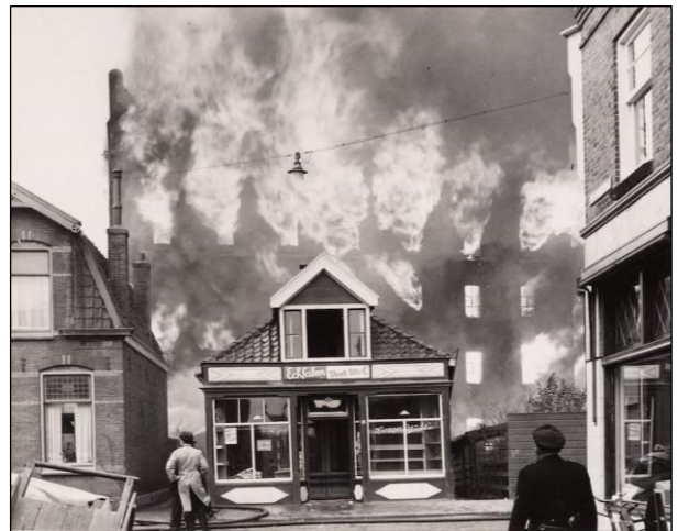
Beeld van de brand vanaf de Oostzijde.